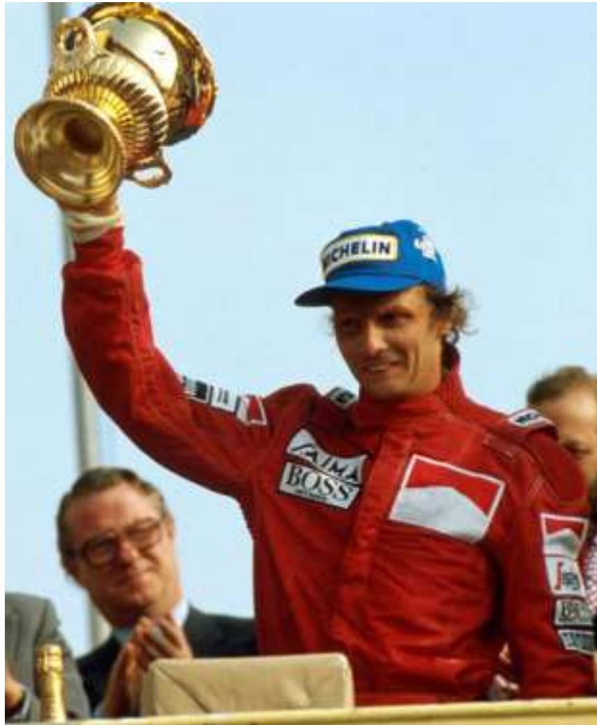
1984 dritter Weltmeister 🖱️