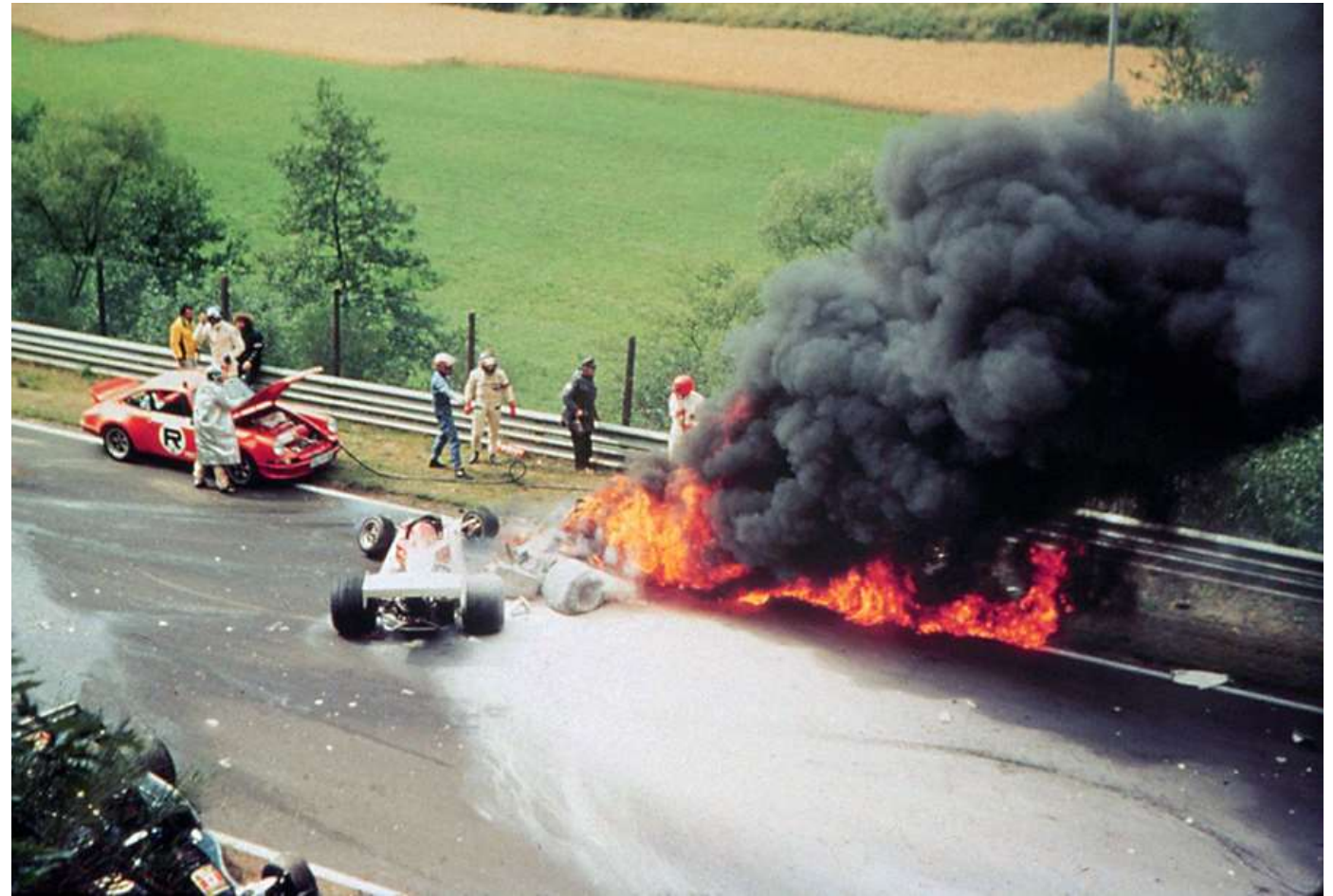
Unfall auf dem Nürburgring am 1. August 1976 🖱️